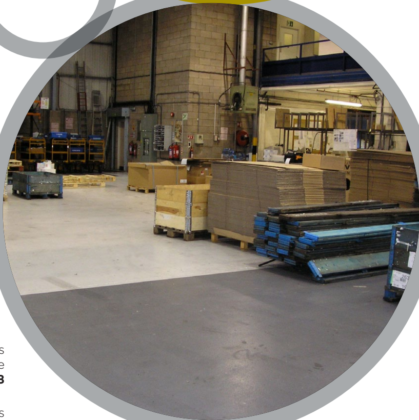
Entrepôt de stockage

Pour de plus amples informations, veuillez vous référer à: