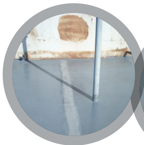
Zones de rétention chimique