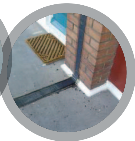
Associations d'assistance au logement